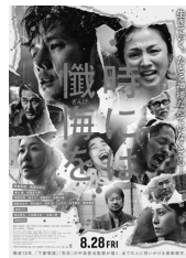
©2025 深緑野分/KADOKAWA/「この本を盗む者は」製作委員会、©来栖夏芽/KADOKAWA/不知火高校製作委員会、 ©2026/米織・仁藤あかね/KADOKAWA/「捨てられ聖女の異世界ごはん旅」製作委員会、 ©佐藤二朗 永田諒 / ヒーローズ ©2026 映画「名無し」製作委員会、©2026 映画「時には懺悔を」製作委員会